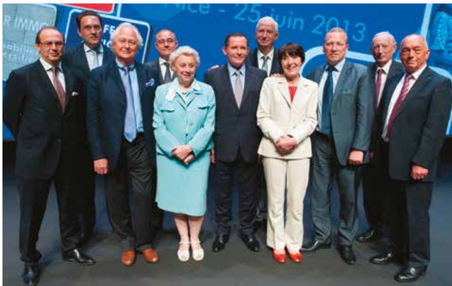
Votre Conseil d'administration : pour des décisions collégiales

► Sur les prélèvements sociaux retenus en 2011 , le Président indique que la prise en compte des prélèvements sociaux au taux de 13,5 % sur l'ensemble des intérêts de l'année a été réalisée pour éviter tout risque de requalification fiscale pour les adhérents. Un rescrit a ensuite été envoyé au ministère des finances, qui n'a eu de réponse qu'en mai 2013. Ce rescrit a validé les dispositions